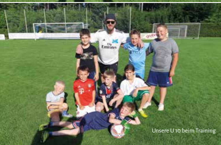
Unsere U10 beim Training