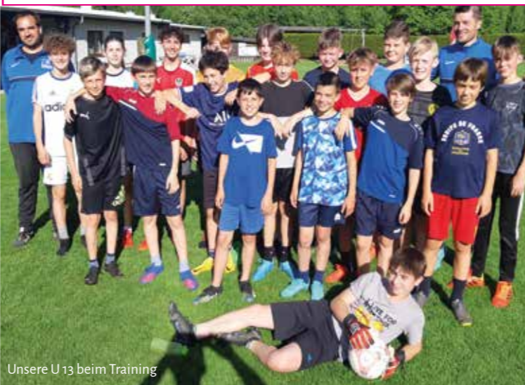
Unsere U13 beim Training