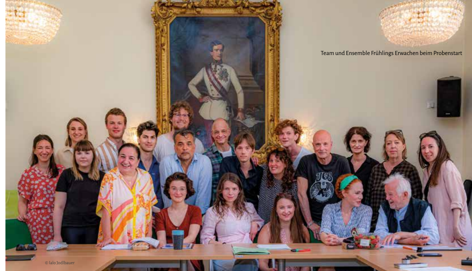
Team und Ensemble Frühlings Erwachen beim Probenstart