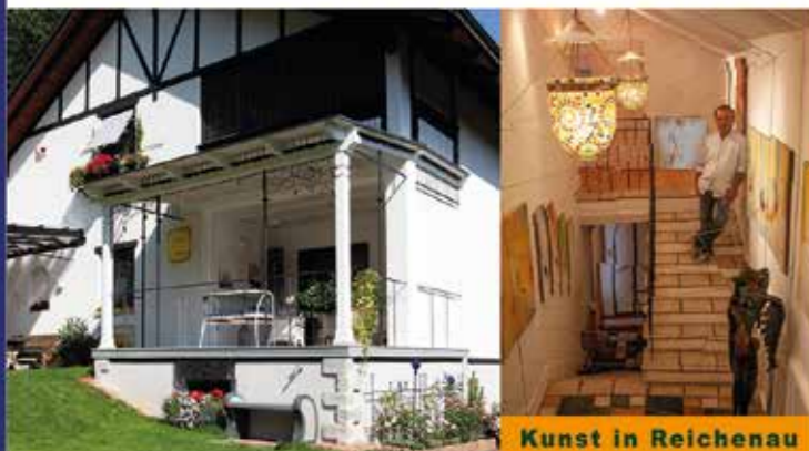
Kunst in Reichenau