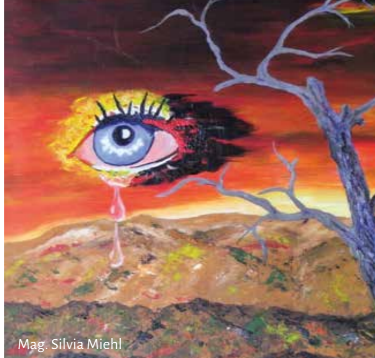
Mag. Sylvia Miehl

Vernissage: 5. Juli 2022 um 18 Uhr Öffnungszeiten: 5. - 12.7. täglich von 14-18 Uhr