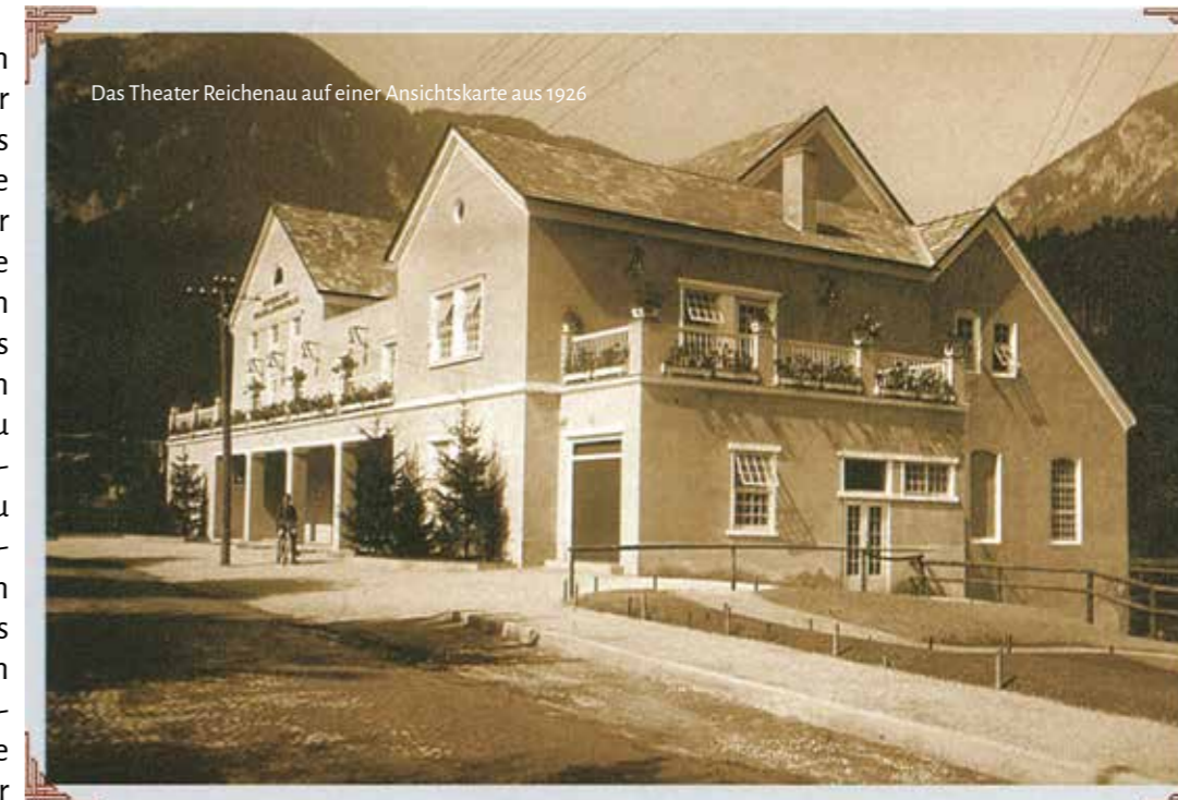
Das Theater Reichenau auf einer Ansichtskarte aus 1926

Spaziergängen). Seit der Zeit konnte man in diesem Haus, das in seinem Erscheinungsbild nicht wesentlich verändert wurde, Theater, Operetten, Kinoführungen, Kabarett und lange Jahre die Festspiele Reichenau genießen, die heuer unter neuer Leitung wiedereröffnet werden.