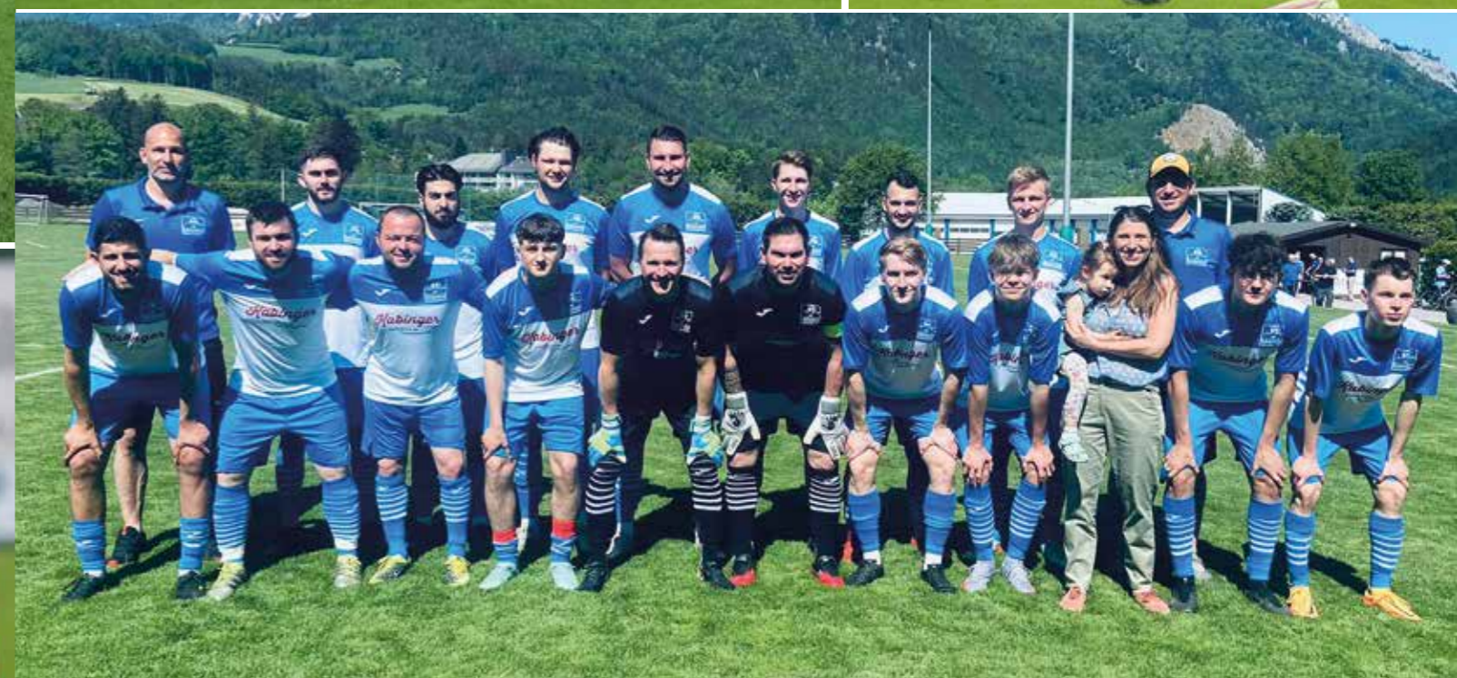
Die Kampfmannschaft bei der Dressenübergabe durch die Firma Kabinger im Mai