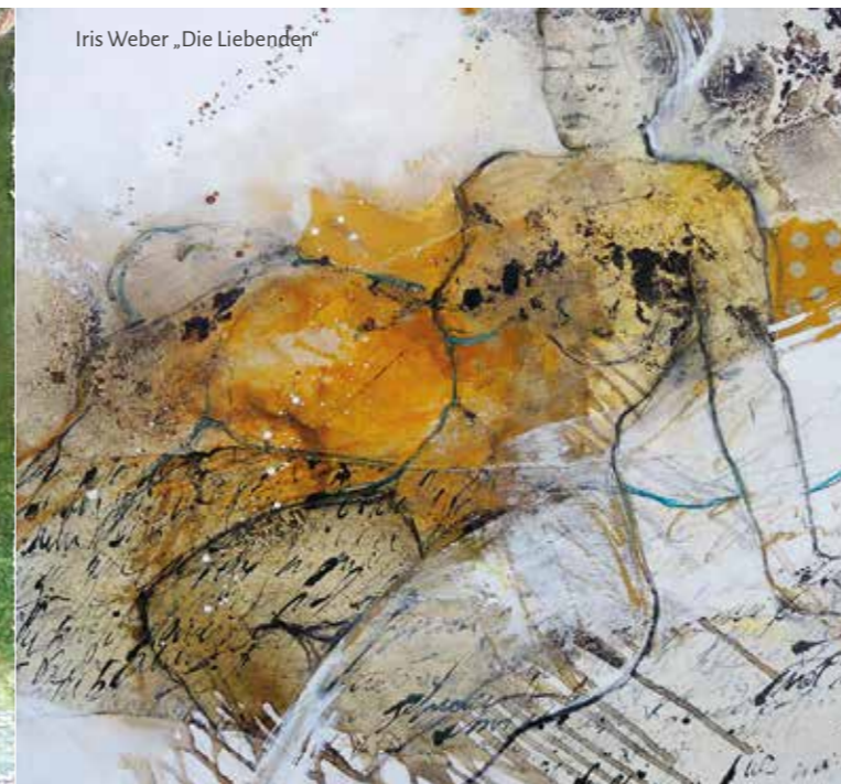
Iris Weber „Die Liebenden“