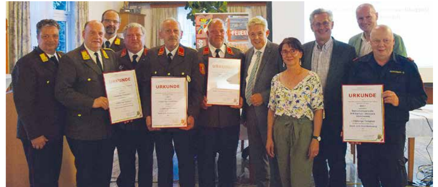
2022 - ein Jubiläumsjahr für unsere Freiwilligen Feuerwehren. Beim Abschnittsfeuerwehrtag am 19. Mai im

Gasthof Kobald wurden alle Wehren des Gemeindegebietes mehrfach ausgezeichnet. Die Gemeindeführung gratuliert zu den verschiedenen Jubiläen und bedankt sich im Namen der Bevölkerung für die Bereitschaft, Schutz und Hilfe rund um die Uhr zu bieten.